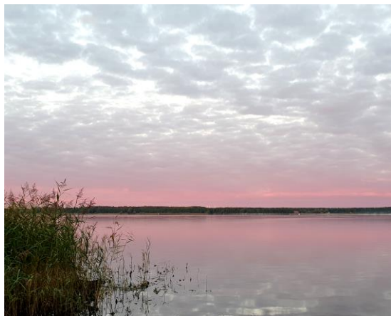
Blick auf unseren Hausstrand/ Plauer See

Jedes Jahr zur Herbstzeit ereignet sich in den Flachwassergebieten Mecklenburgs und Vorpommerns ein ganz besonderes, beeindruckendes Naturschauspiel: Tausende Kraniche legen hier einen Zwischenstopp auf dem Weg gen Süden ein, um zu rasten und frische Kraft für den Aufbruch zu neuen Ufern zu sammeln. Mitten in der malerischen Seenlandschaft Mecklenburg-Vorpommerns liegt das Naturschutzgebiet der „Langenhägener Seewiesen“, ein solcher Kranichrastplatz. Während der Zeit des Vogelzugs können hier die eleganten, wunderschönen „Vögel des Glücks“ über mehrere Wochen hinweg beobachtet werden.