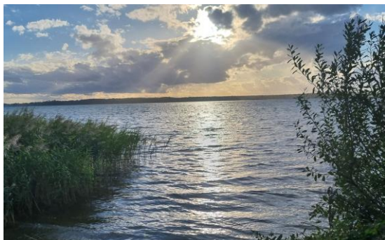
Blick auf unseren Hausstrand/ Plauer See

Jedes Jahr zur Herbstzeit ereignet sich in den Flachwassergebieten Mecklenburgs und Vorpommerns ein ganz besonderes, beeindruckendes Naturschauspiel: Tausende Kraniche legen hier einen Zwischenstopp auf dem Weg gen Süden ein, um zu rasten und frische Kraft für den Aufbruch zu neuen Ufern zu sammeln. Mitten in der malerischen Seenlandschaft Mecklenburg-Vorpommerns liegt das Naturschutzgebiet der „Langenhägener Seewiesen“, ein solcher Kranichrastplatz. Während der Zeit des Vogelzugs können hier die eleganten, wunderschönen „Vögel des Glücks“ über mehrere Wochen hinweg beobachtet werden.